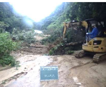
平成30年西日本豪雨による災害復旧工事