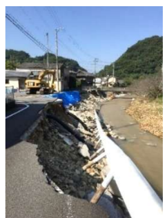
平成29年9月台風18号による災害復旧工事

えひめ建設業BCP等審査会(事業継続計画)の認定を受け、災害時にいち早く復旧活動を行っております。↓