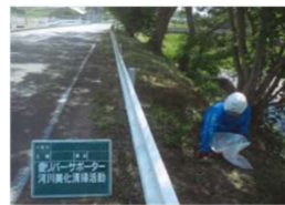
愛リバー・サポーター制度